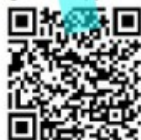
Qr-code app Android